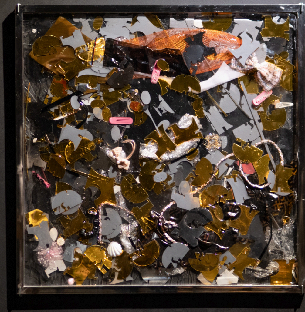
cha lên | chủ lên | challen | channel | chanel | miếu miếu | miu miu found materials, Vietnamese lacquer fa kê 2024, 76 cm2