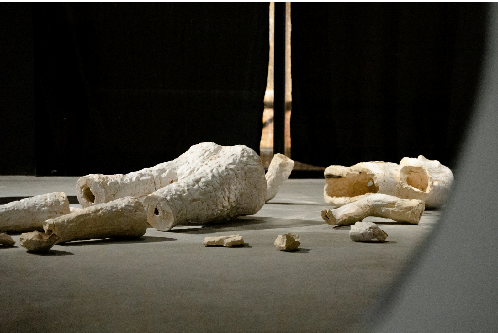
untitled (THD) white-glazed ceramic 2020-24, 169 cm