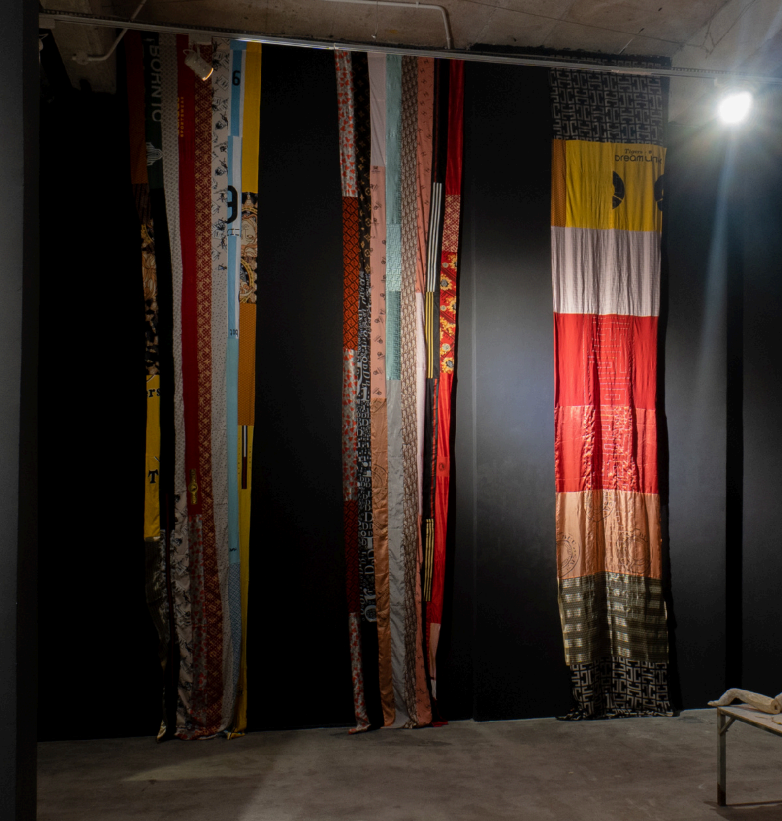
A-di-đà | A di das Artist's clothing 2024, 480 x 88 cm