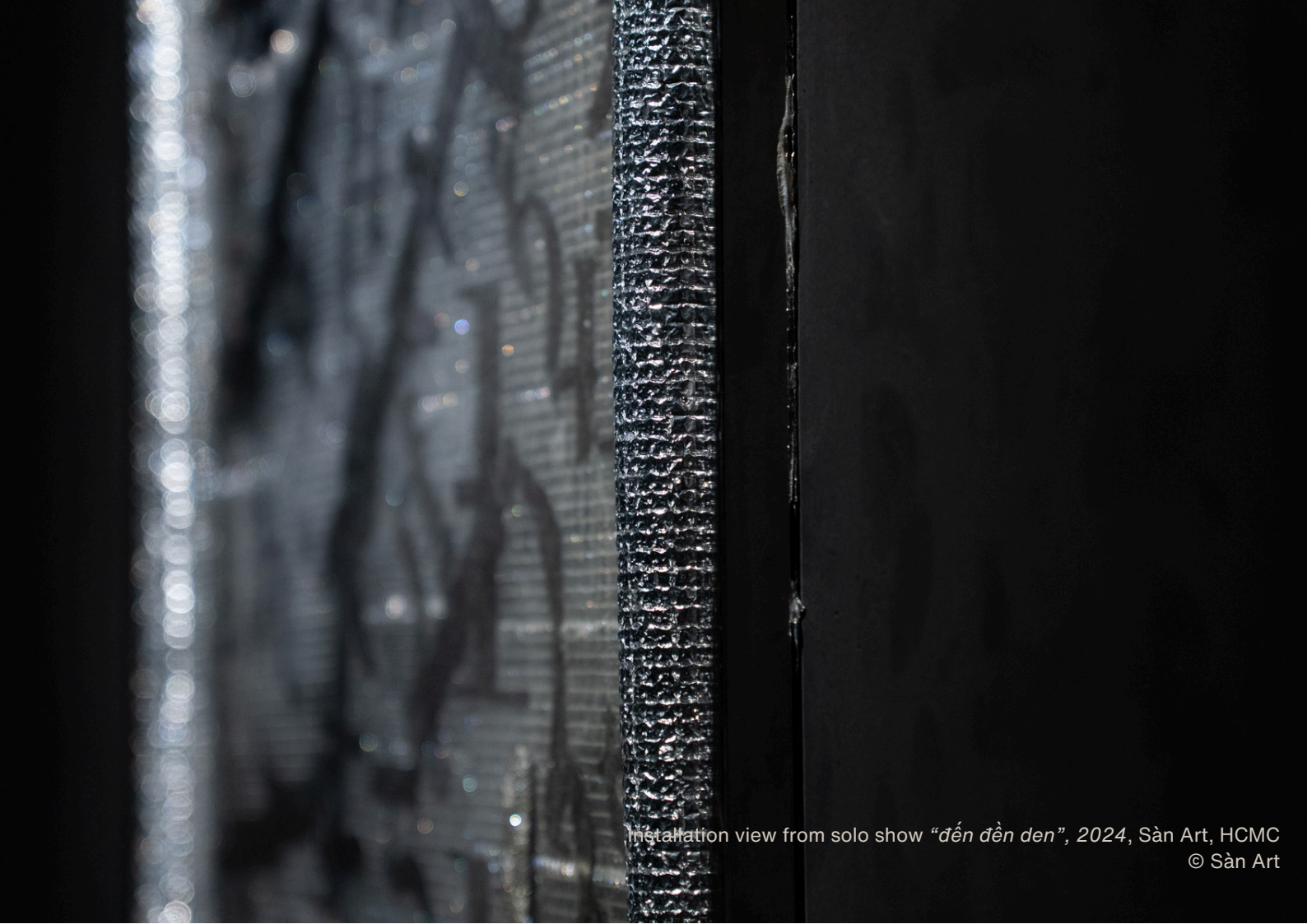
Installation view from solo show "đến đến đến", 2024, Sàn Art, HCMC