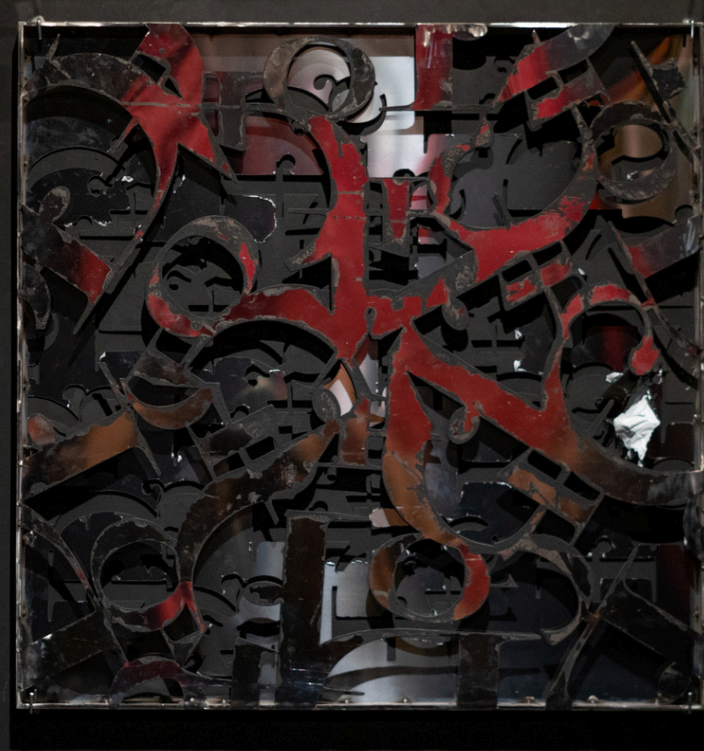
Installation view from solo show “đến đèn đen”, 2024, Sàn Art, HCMC