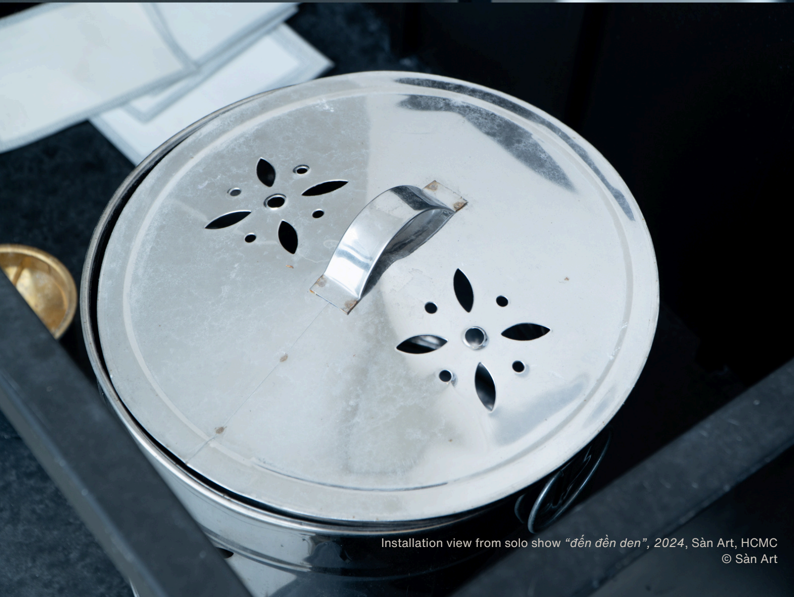
Installation view from solo show “đến đên đên”, 2024, Sàn Art, HCMC