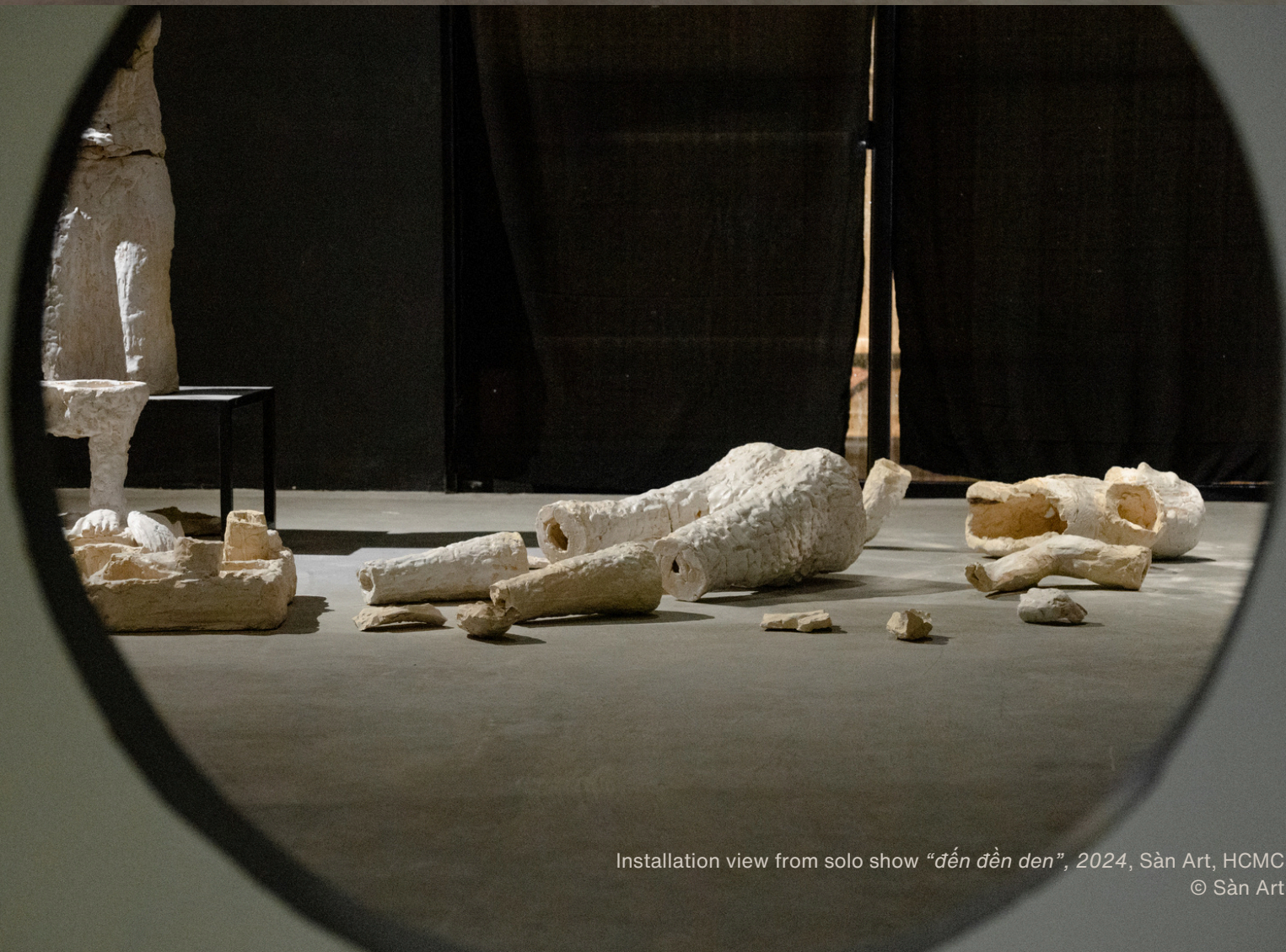
Installation view from solo show “đến đên đên”, 2024, Sàn Art, HCMC