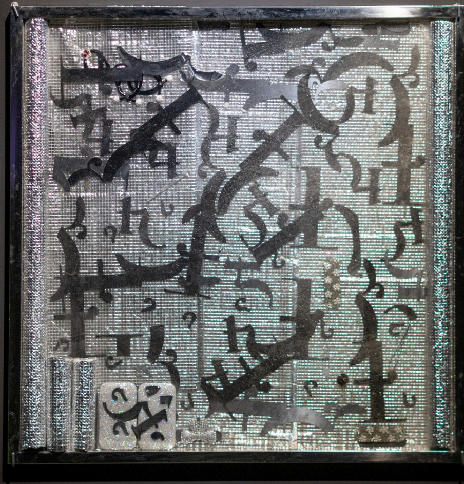
Mio Dio | Cucci Tunnel Vision (silver fox edit) readymades, Vietnamese lacquer fa kê 2024, 76 cm2