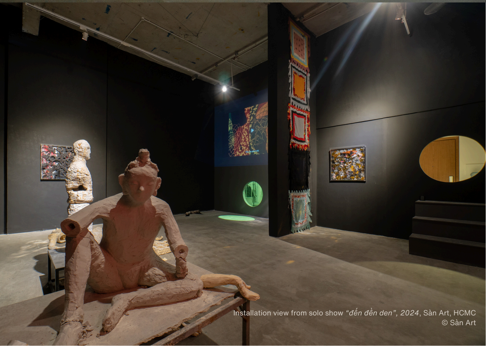
Installation view from solo show "đến đên đên", 2024, Sàn Art, HCMC