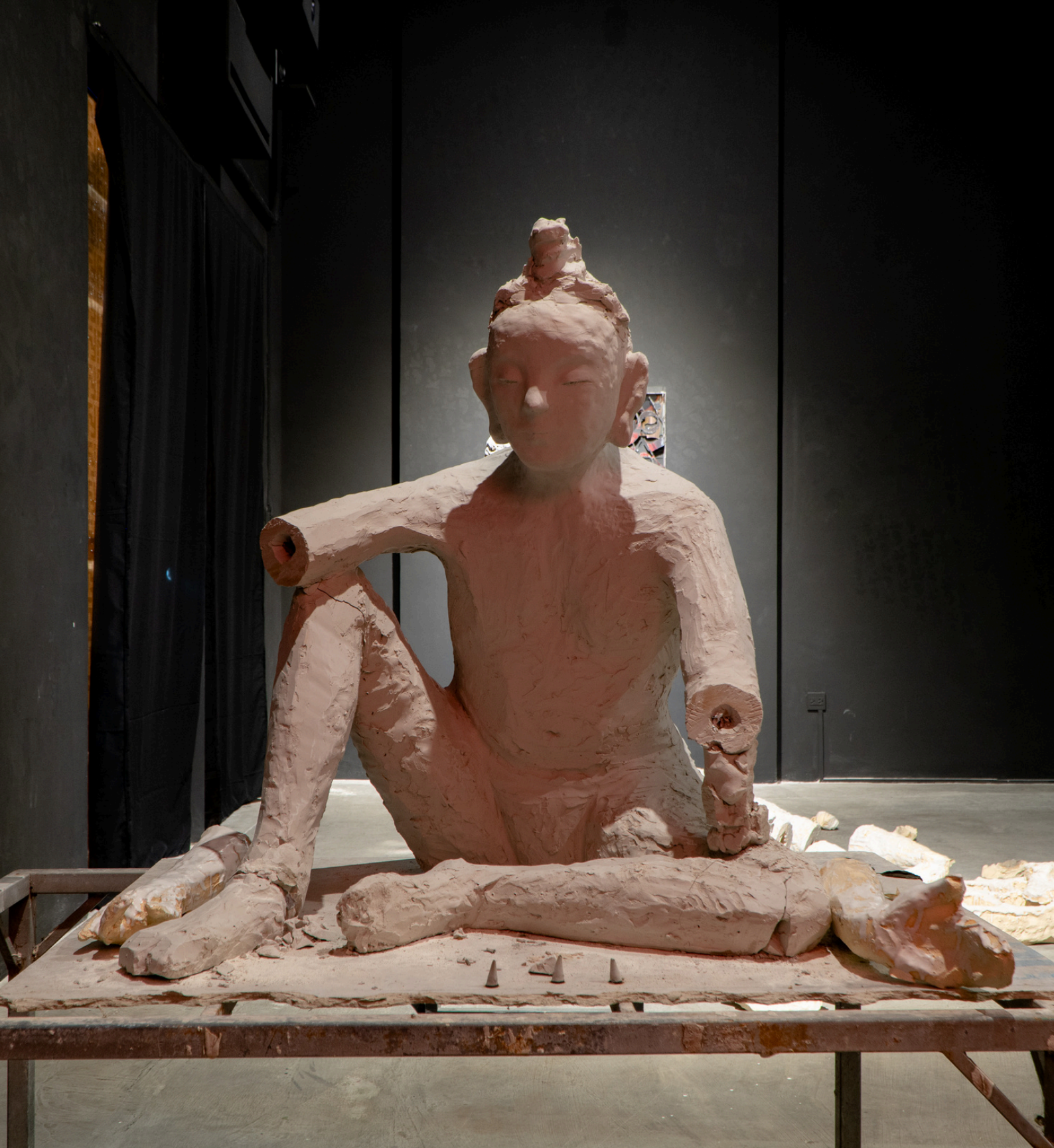
untitled (CB, LH, QA) white-glazed ceramic 2020-24, 169 cm