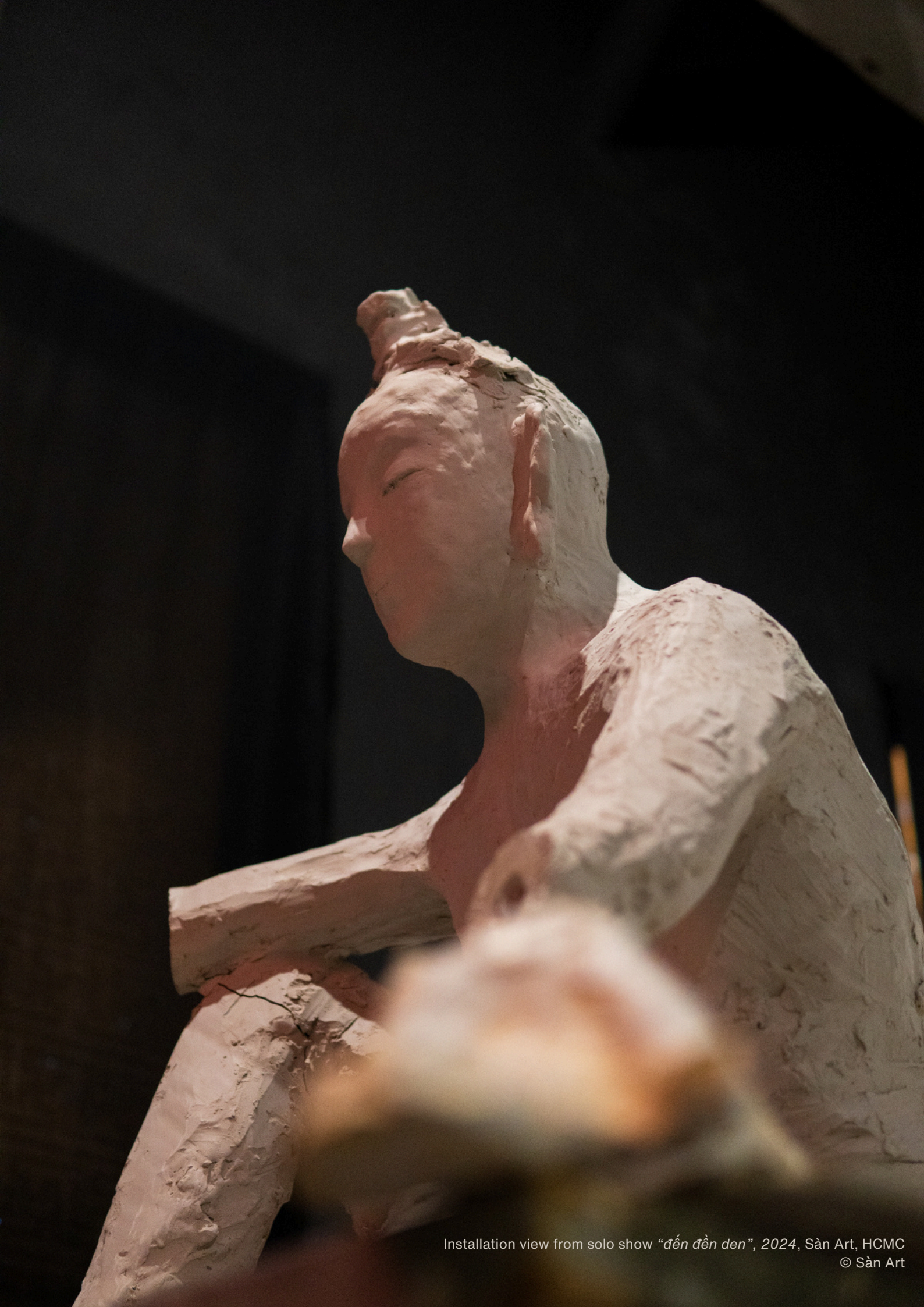
Installation view from solo show “đến đên đên”, 2024, Sàn Art, HCMC